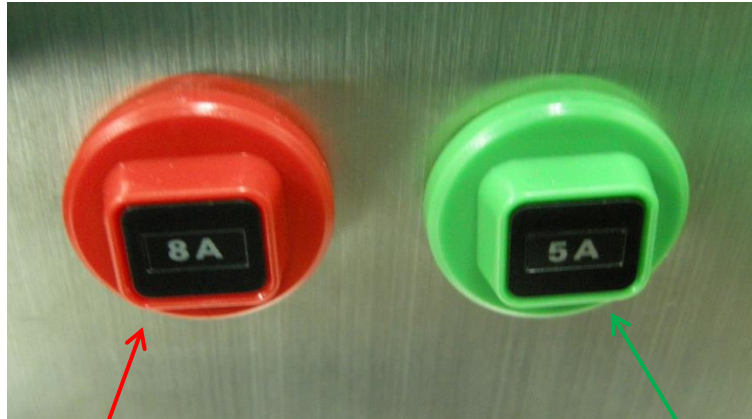
ヒーター用サーキットプロテクタ