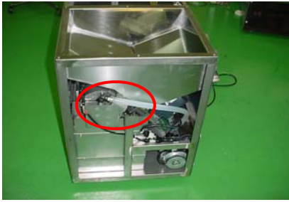
左側面のカバーを外す